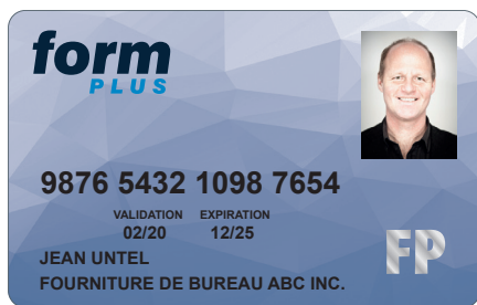
Photo Technologie de carte opaque ou transparente Estampage à chaud

Impression couleur Personnalisation par imagerie thermique