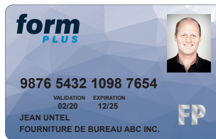
Photo Technologie de carte opaque ou transparente Estampage à chaud

Impression couleur Personnalisation par imagerie thermique