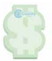
" $ "