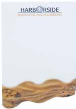
Vague angulaire/Angled wave

IMAGES DU FOND BISEAUTÉ BEVEL STOCK BACKGROUNDS