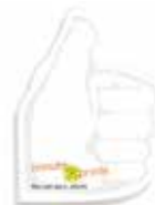
Pouce en l'air/Thumbs up