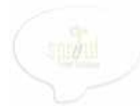
Bulle de dialogue/Speech bubble