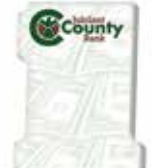
" 1 "