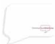
Bulle de pensée/Thought bubble