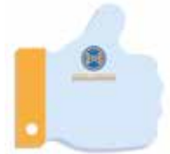
Pouce en l'air/Thumbs up